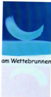
Galerie am Wettebrunnen

Öffnungszeiten: Fr. 14 bis 19 Uhr Sa. 11 bis 13 Uhr, So. 11 bis 18 Uhr