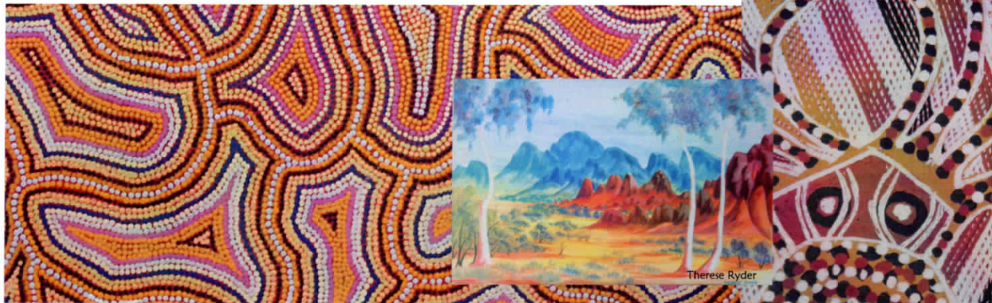
Detail Lola Napijinpa Brown